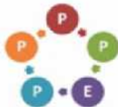
Gambar: Siklus Standar Pendidikan

Penetapan Standar Pendidikan Pelaksanaan Standar Pendidikan Evaluasi Standar Pendidikan Pengendalian Standar Pendidikan Peningkatan Standar Pendidikan